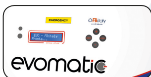
DISPLAY MULTIFUNZIONE MULTIFUNCTIONAL DISPLAY