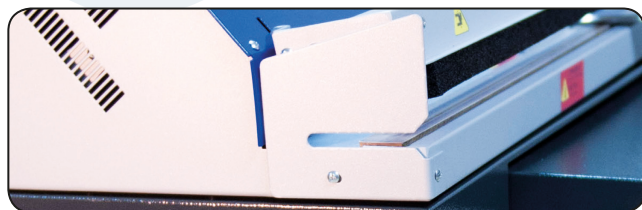
POSSIBILITÀ DI SALDATURA CONTINUA CONTINUOUS WELDING CHANGE