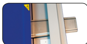
UNITÀ DI ASPIRAZIONE AUTOMATICA INDEPENDENT INTAKE AIR UNIT