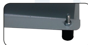
POMPA A VUOTO SU CULLA ANTIVIBRAZIONE ANTI-VIBRATION SUPORT ON VACUUM PUMP