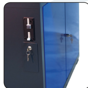
GETTONIERA INTEGRATA INTEGRATED TOKEN DISPENSER