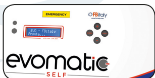
DISPLAY MULTIFUNZIONE MULTIFUNCTIONAL DISPLAY

With the smart help of electrical actuators, the machine doesn't need any other energetic sources such as compressed air, making the installation easier.