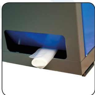
DISTRIBUTORE DI BUSTE BAGS DISPENSER MANAGEMENT